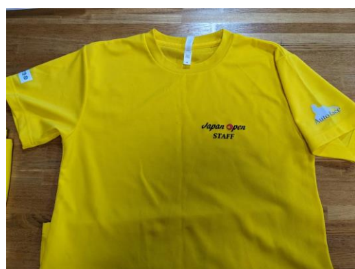
スタッフユニフォーム