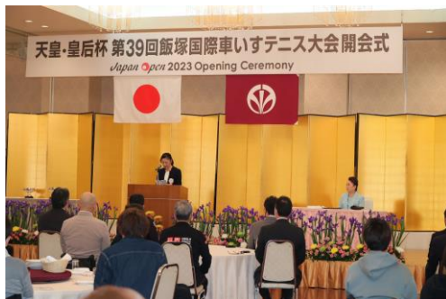
開会式に寛仁親王信子妃殿下ご臨席