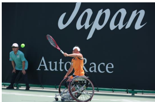
女子シングルス (上地結衣選手)