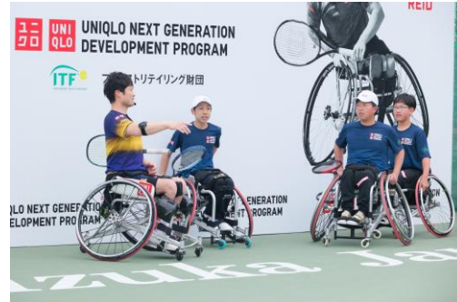
国枝慎吾氏によるジュニアクリニック開催