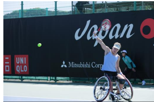
女子シングルス優勝の Diede De Groot 選手