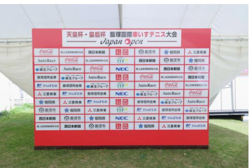
インタビューボード