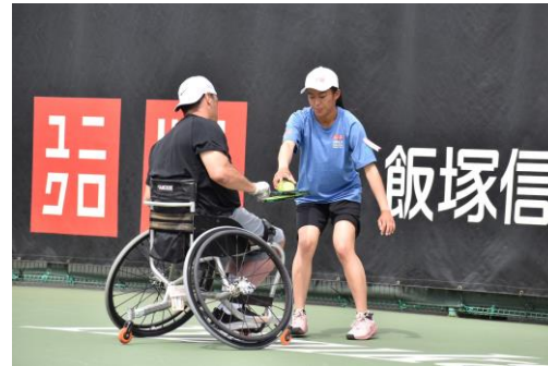
ボールパーソンボランティアの学生