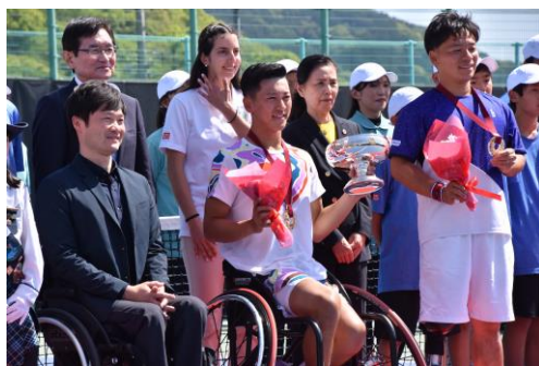
男子シングルス表彰式