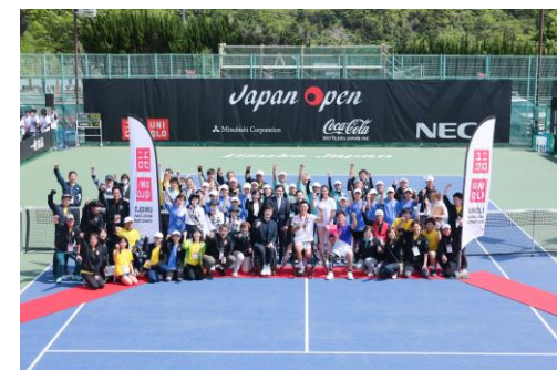
表彰式後の記念撮影